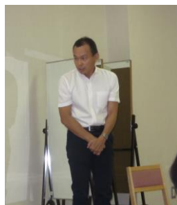
来賓の和歌山市障害者支援課長