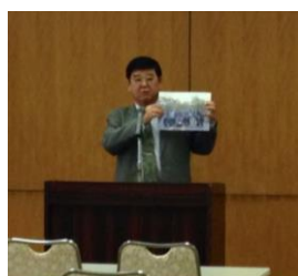
大久保会長の挨拶