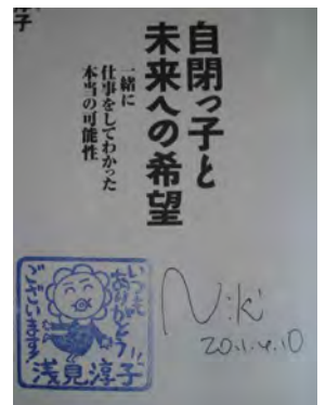
ニキさんの手書きサイン